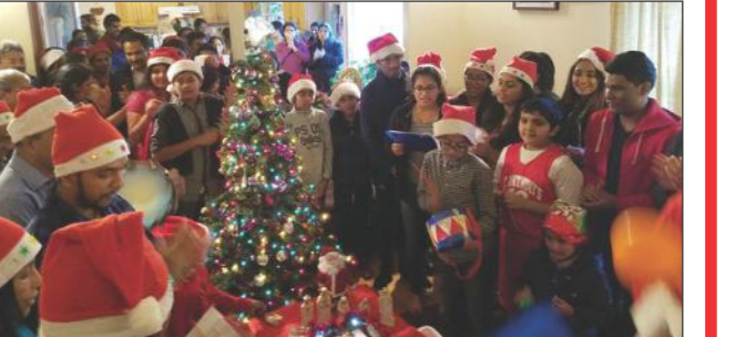
ക്രിസ്മസ് കരോളിൽ നിന്ന്