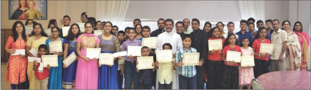
ഗ്രാജുവേഷൻ സെനിയറിയിൽ നിന്ന്