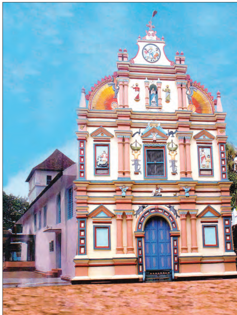
തിരുനാൾദിനങ്ങൾ വിശ്വാസികളെ നേർത്തും ദൈവികകാര്യങ്ങളു തിനായി നേർത്തും കൊണ്ടുവന്നതാണ്. നേർത്തും കൊണ്ടുവന്നതാണ്. നേർത്തും കൊണ്ടുവന്നതാണ്.

സമുദ്രാഭിമുഖ പ്രാർത്ഥന കടുത്തുരുത്തി വലിയപള്ളിയിൽ മാത്രം കാണുന്ന മറ്റൊരു തിരുകുരിശാണിത്. മൂന്നുനോമ്പിന്റെ മൂന്നാം ദിവസം മരിച്ചുപോയ പൂർവ്വികരെ അനുസ്മരിക്കുന്ന ചടങ്ങ്. ഉയിർപ്പിന്റെ പ്രഖ്യാപനത്തിനുശേഷം ഉയിർക്കത്തക്കുന്നേറ്റ ക്രിസ്തുവിന്റെ രൂപവും വഹിച്ചുകൊണ്ട് ജനങ്ങളെല്ലാവരും പള്ളിയുടെ പടിഞ്ഞാറ് അധികം ദൂരമല്ലാതെ കുരിശുമുടുകുടിയിൽ സ്ഥാപിച്ചിരിക്കുന്ന കുരിശിയിലേക്ക് തിരികൾ കത്തിച്ച് പ്രദക്ഷിണമായിപോയി എ.ഡി. 345 ലെ കുടിത്തോഴിയിൽ മരിച്ച് കടലിൽ സംസ്കരിക്കപ്പെട്ട പൂർവ്വികരെ അനുസ്മരിച്ച് പ്രാർത്ഥിക്കുന്നു.